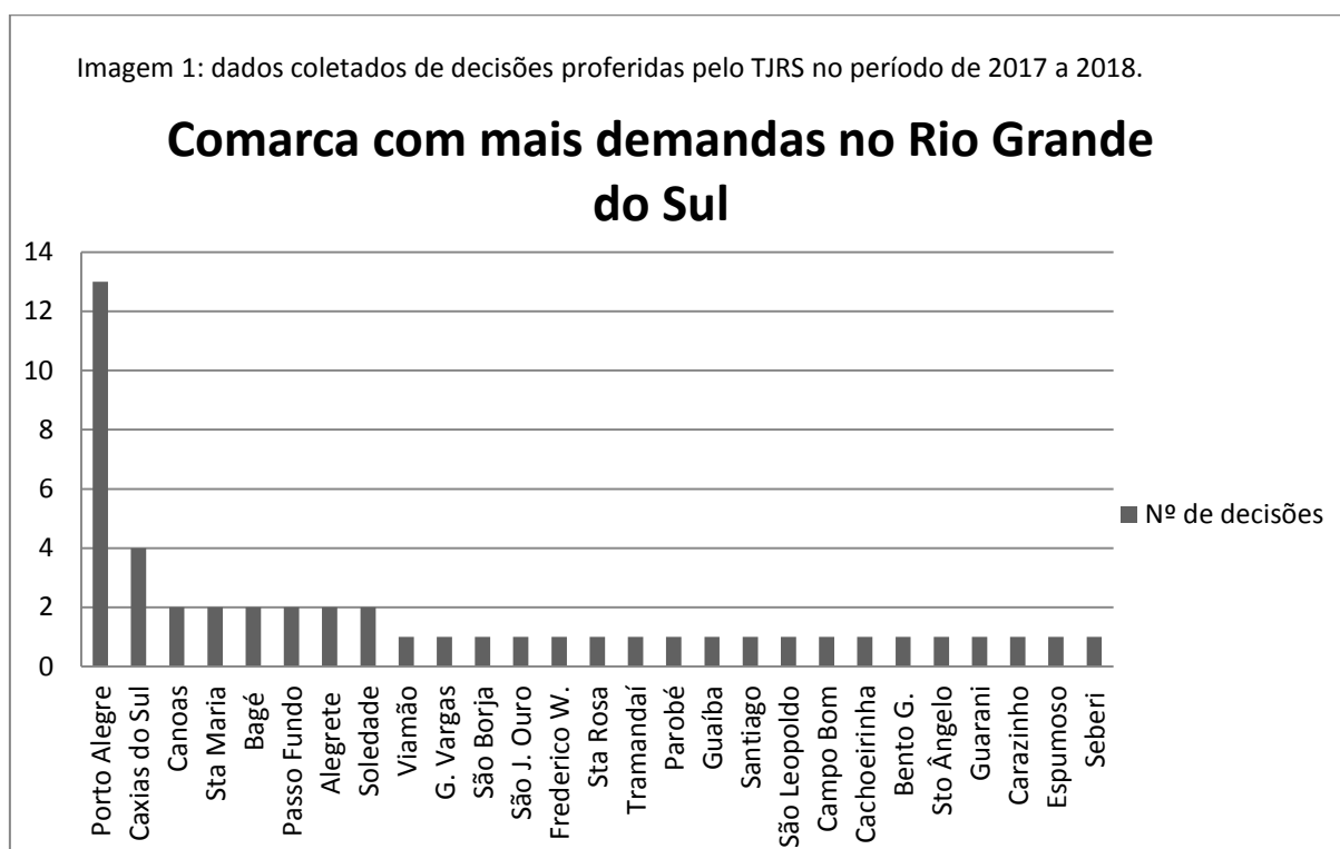
Gráfico 1

Nesse sentido, nota-se que dentre todos os casos pesquisados, a comarca onde há mais incidência de demandas sobre este assunto no período de março de 2017 a setembro de 2018 foi a capital Porto Alegre, conforme demonstrado no gráfico abaixo. Além dela, Caxias do Sul aparece na segunda posição de comarcas com mais demandas envolvendo os marketplaces .